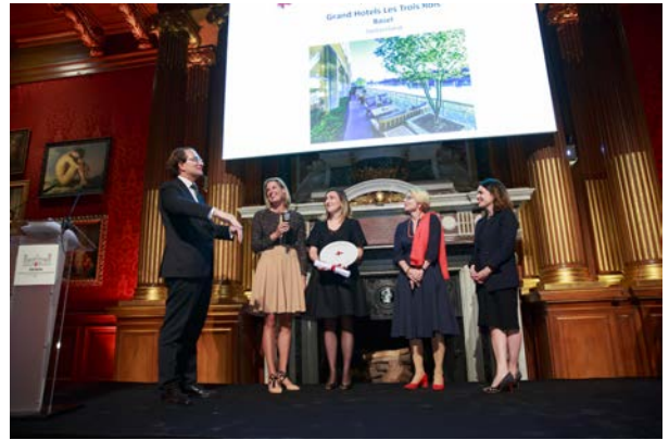
Remise du prix avec Livia Leu, ambassadrice de Suisse en France