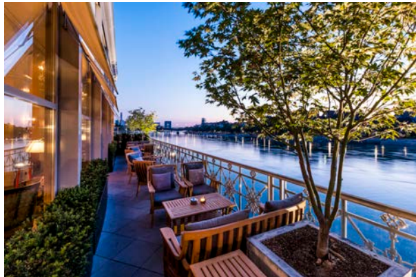
Terrasse du Grand Hotel Les Trois Rois