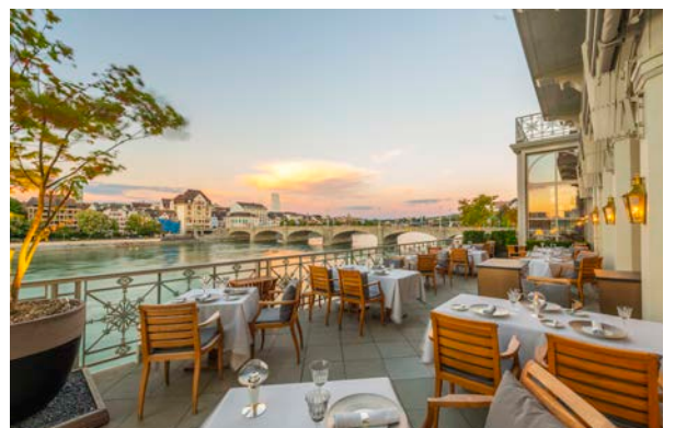
Terrasse du restaurant Cheval Blanc by Peter Knogl, avec 3 étoiles au Guide Michelin

Grand Hotel LES TROIS ROIS Blumenrain 8 | CH-4001 Basel | Switzerland T +41 61 260 50 50 | F +41 61 260 50 60 | info@lestroisrois.com www.lestroisrois.com