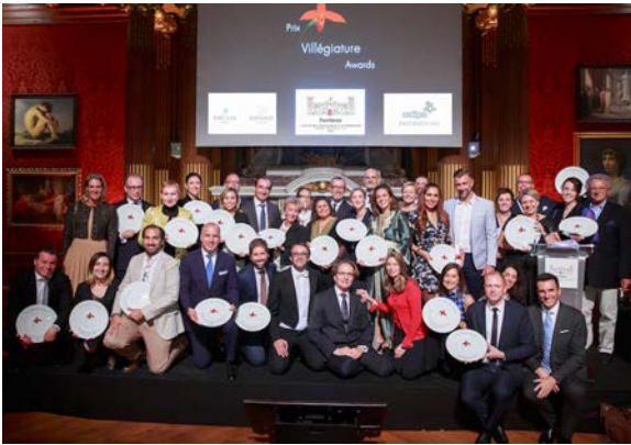
Tous les lauréats du Prix Villégiature 2018