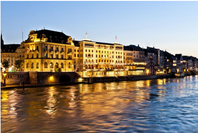
Grand Hotel Les Trois Rois