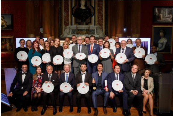
Alle Prix Villégiature-Gewinner 2019