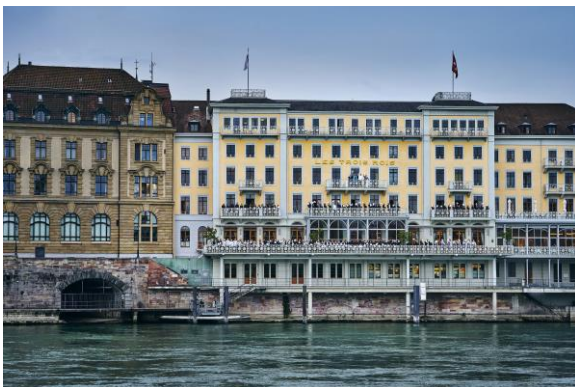
Grand Hotel Les Trois Rois