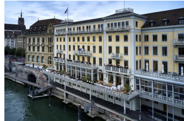
Grand Hotel Les Trois Rois