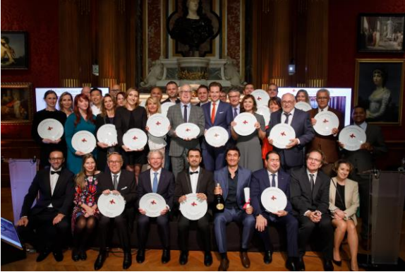
Tous les lauréats du Prix Villégiature 2019